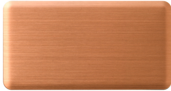
FTU-001 浅古铜 Light Antique Copper