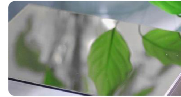
FTS-001 不锈钢 (8K) Stainless Steel(8K)