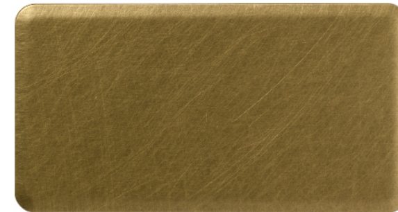
FTU-008 青铜和纹 Textured Bronze