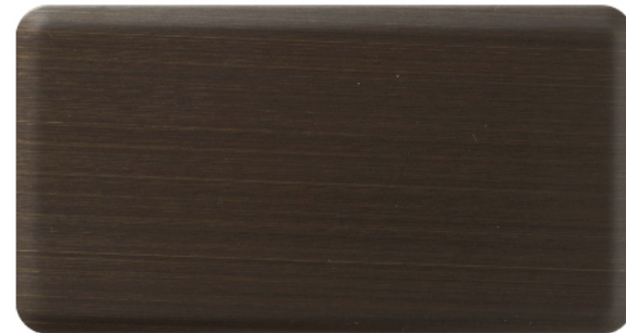
FTU-007 深青铜 Dark Bronze