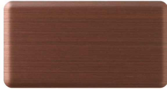
FTU-002 中古铜 Medium Antique Copper