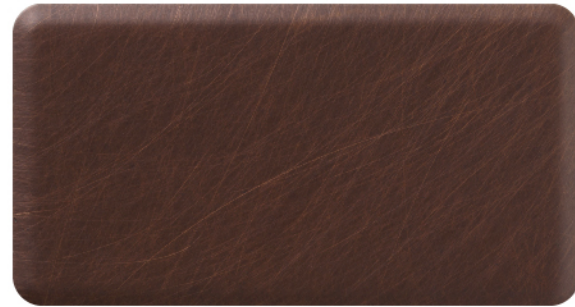
FTU-004 古铜和纹 Textured Antique Copper