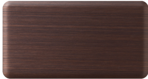
FTU-003 深古铜 Dark Antique Copper