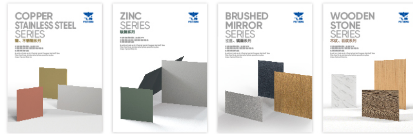
铜、不锈钢系列 钛锌系列 拉丝、镜面系列 木纹、石纹系列