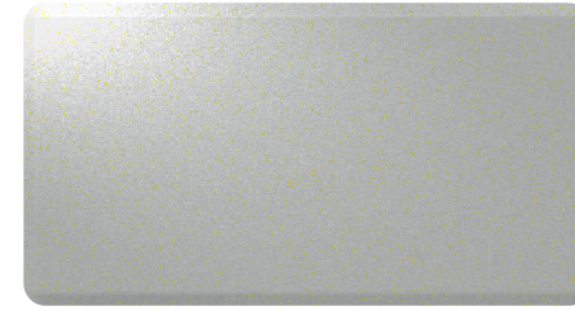
FTS-002 不锈钢 (喷砂) Stainless Steel(Sandblast)