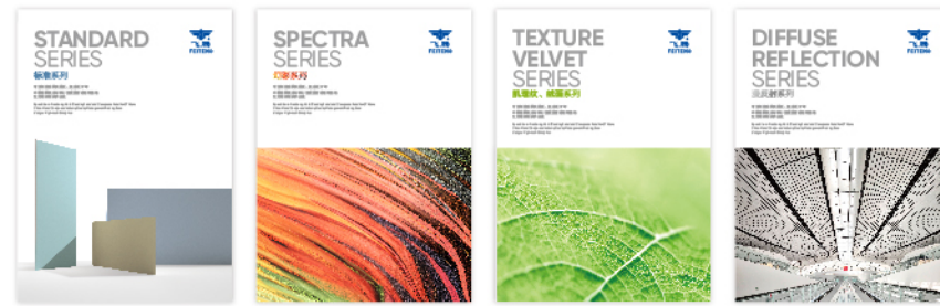
标准系列 幻彩系列 肌理纹、绒面系列 漫反射系列