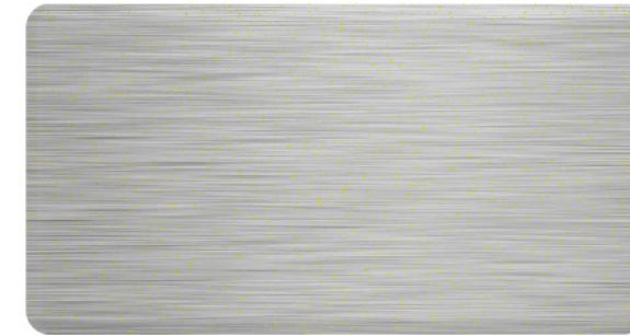
FTS-004 不锈钢 (短拉丝) Stainless Steel(Short Brush)