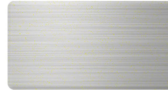
FTS-003 不锈钢 (长拉丝) Stainless Steel(Long Brush)