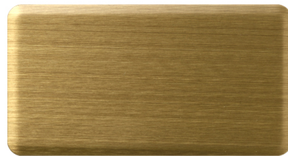
FTU-005 浅青铜 Light Bronze