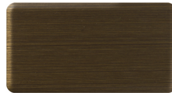
FTU-006 中青铜 Medium Bronze